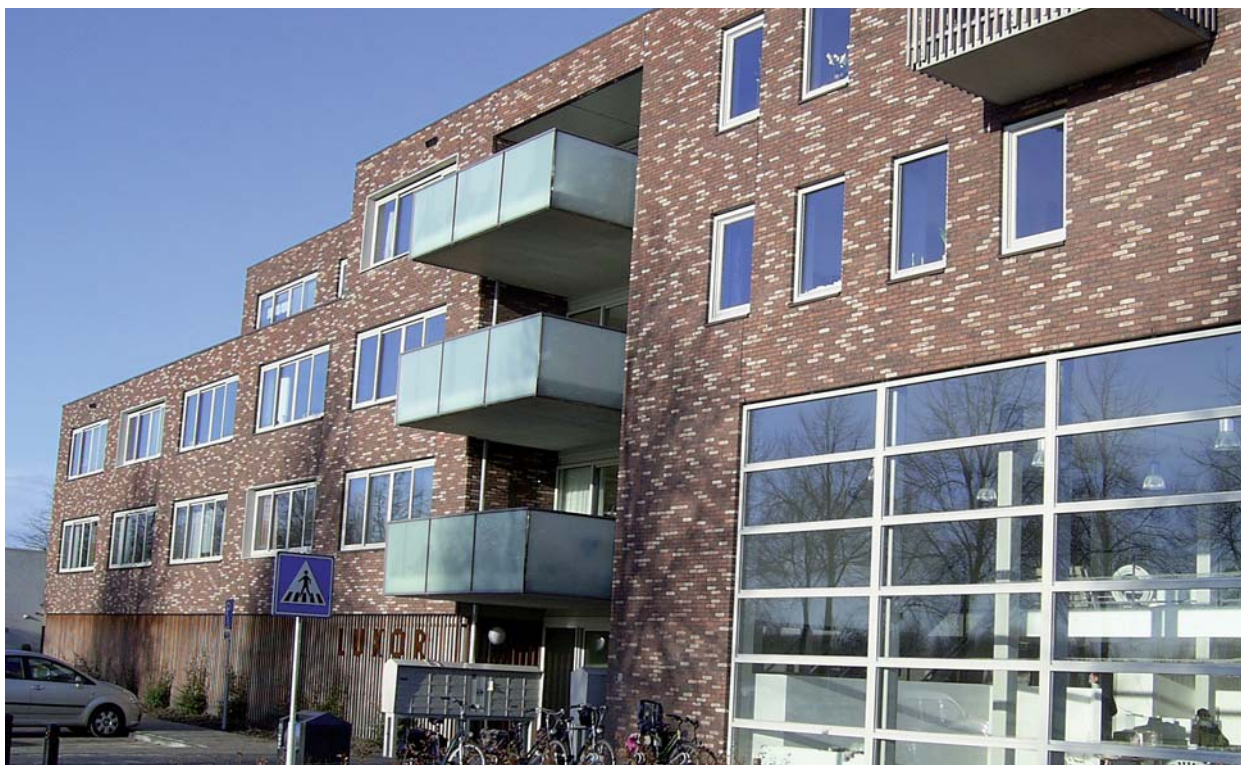
Luxor aan de Flevoweg