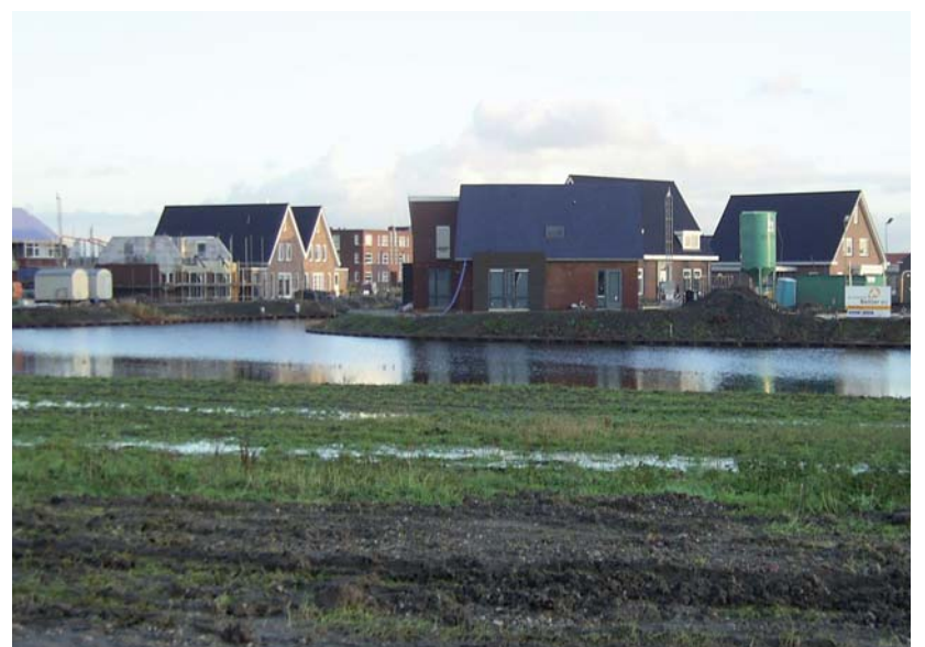
Vrije kavels aan de vaarroute Blauwe Diamant

Het Rijk wil dat de gemeente Almere nog veel verder doorgroeit dan aanvankelijk de bedoeling was. Men verwacht tot 2040 een grote druk op de woningmarkt. Leefbaar Zeewolde vindt de onderbouwing van al die plannen erg mager. Het zal betekenen dat Almere richting Zeewolde gaat uitbreiden. Nog erger is het dat Almere eigenlijk vindt dat de gemeentegrenzen moeten worden gewijzigd. De provincie lijkt dat ook wel te willen. Leefbaar Zeewolde is van mening dat het huidige college onvoldoende tegengas geeft met alle mogelijke consequenties van dien. Als de noodzaak van meer woningbouw keihard wordt aangetoond, dan moet Zeewolde in de te maken visie uitstralen, dat Zeewolde op termijn zelf een tweede kern kan bouwen op haar eigen grondgebied bij Almere. Leefbaar Zeewolde vindt dat na voltooiing van de Polderwijk, het huidige dorp af is. Verdere uitbreiding van deze kern is wat ons betreft geen optie. Uit de Leefbaarheidsmonitor blijkt ook telkens opnieuw dat een grote meerderheid van de inwoners ons daarin steunt. Wij begrijpen dan ook niet waarom het nieuwe college van CDA, PvdA/GroenLinks en ChristenUnie proefballonnetjes oplaat om Zeewolde te laten doorgroeiën naar 45.000 inwoners. Opnieuw een teken dat deze partijen niet naar de inwoners luisteren.