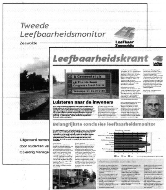
Huis-aan-huis krant en publieksvriendelijke versie van de Leefbaarheidsmonitor

Een andere beperking is dat actuele beleidsvoorstellen niet met deze methode kunnen worden getoetst. De leefbaarheidsmonitor heeft tot doel langetermijnbeleid te monitoren en niet actuele voorstellen voor te leggen. Ten slotte is de leefbaarheidsmonitor geen verkiezingsprogramma. Partijen zijn gestoeld op principes en de resultaten van de monitor kunnen slechts bevestigen of ontkennen dat de bevolking het hiermee eens is. Een goede interpretatie van de resultaten kan dan uiteindelijk leiden tot een gezamenlijk optreden van de politiek in het belang van de inwoners waardoor de monitor niet alleen de kloof tussen politiek en burger kan verkleinen maar ook onderlinge verschillen tussen de politieke partijen.