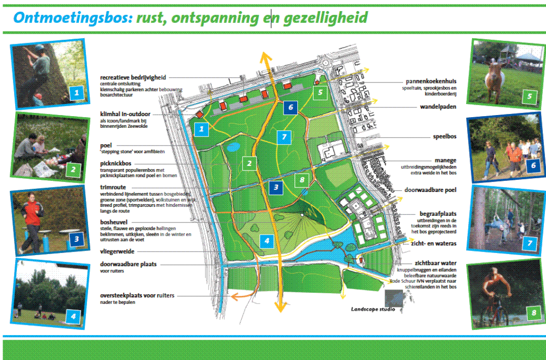
Figuur 4. Van G-gebied naar Ontmoetingsbos. Het plan van Leefbaar Zeewolde om het G-gebied om te vormen naar een bos waar alle Zeewoldenaren kunnen recreëren en van de natuur genieten.