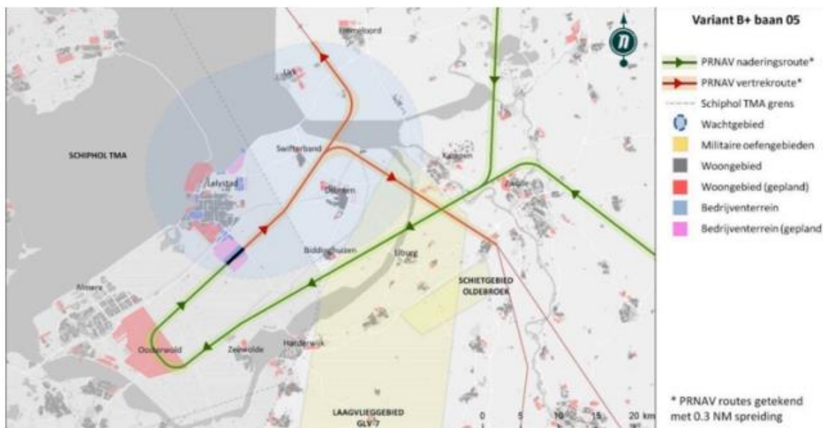
Figuur 1. Aan en uitvliegroutes vanaf Lelystad Airport.