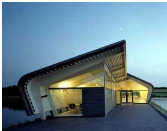
Figuur 2. De Verbeelding